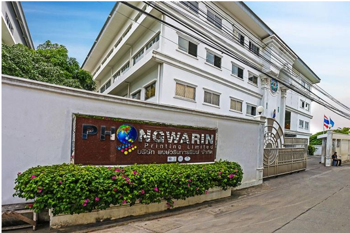
ภาพที่ ค.1 ป้ายหน้าบริษัท