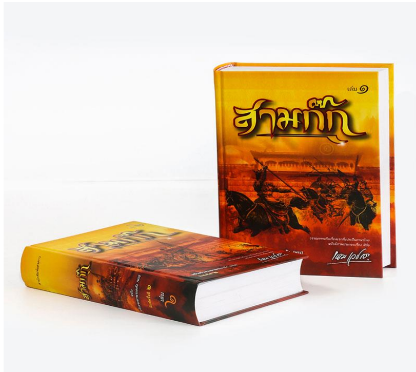
ภาพที่ 2.8 หนังสือปกแข็ง