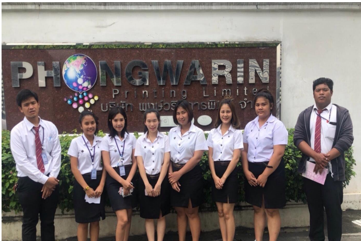
ภาพที่ค.2 การเข้าไปศึกษาดูงานในบริษัท พงษ์วารินการพิมพ์ จำกัด