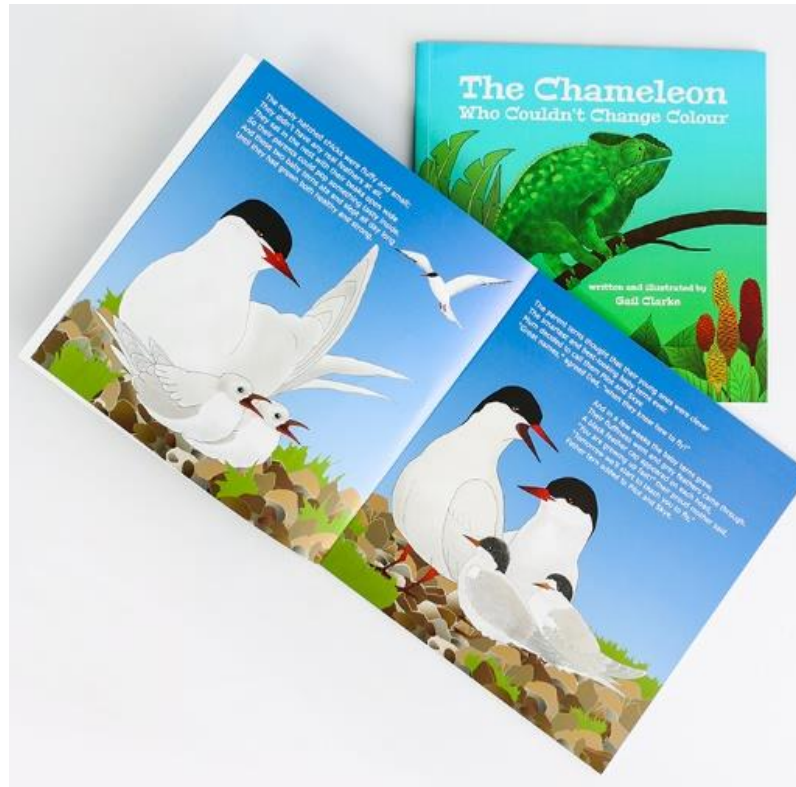
ภาพที่ 2.7 หนังสือเด็ก