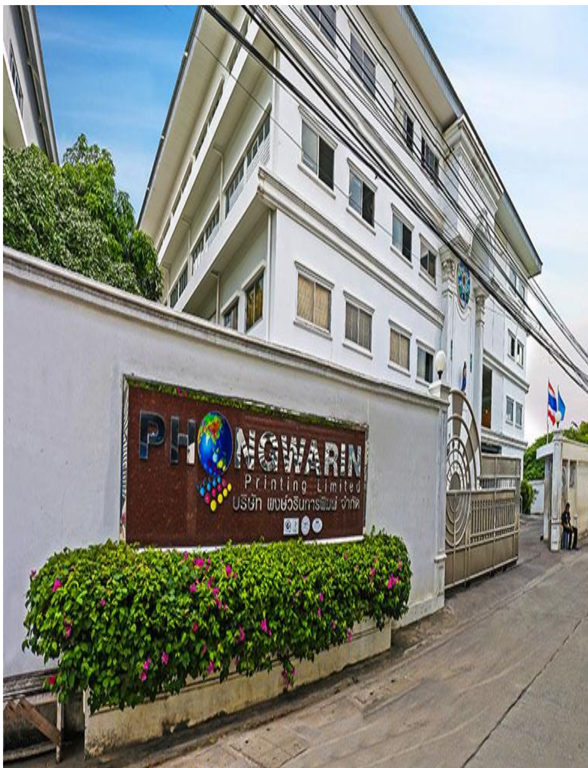
ภาพที่ 2.1 ป้ายหน้าบริษัท พงษ์วารินการพิมพ์ จำกัด