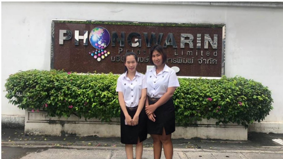
ภาพที่ 4.1 นักศึกษาเข้าเยี่ยมชมบริษัท พงษ์วารินการพิมพ์ จำกัด

เป็นการวิเคราะห์ การพัฒนา จากการศึกษาที่ได้ไปศึกษากระบวนการนำเข้าวัตถุดิบ กระจายอาร์ตด้าน จากต่างประเทศหรือในประเทศ กรณีศึกษา บริษัท พงษ์วารินการพิมพ์ จำกัด ซึ่ง บริษัทเป็นผู้นำเข้าสินค้า กระจายอาร์ตด้าน ตามความต้องการของลูกค้า โดยการนำเข้าอย่างมีประสิทธิภาพ คณะผู้จัดทำได้เข้าเยี่ยมชมศึกษาดูงานเมื่อวันที่ 8 กันยายน 2561 โคนมีผลศึกษาตาม วัตถุประสงค์ดังนี้