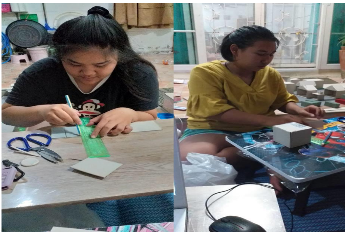
ภาพที่ ข.2 การทำโครงสร้างอาคาร