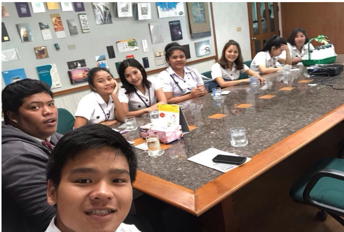
ภาพที่ค.3 ไปศึกษาดูงานที่ บริษัท พงษ์วรินทร์การพิมพ์