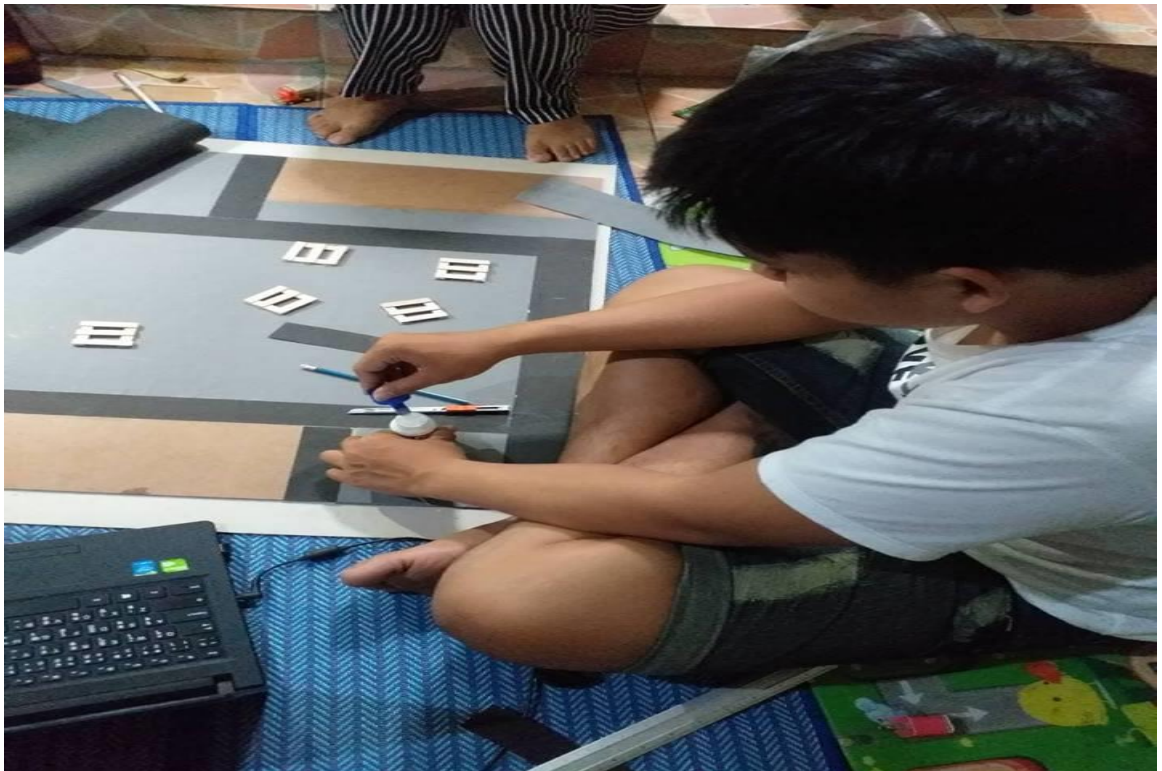
ภาพที่ ข.4 การทำพาเลท