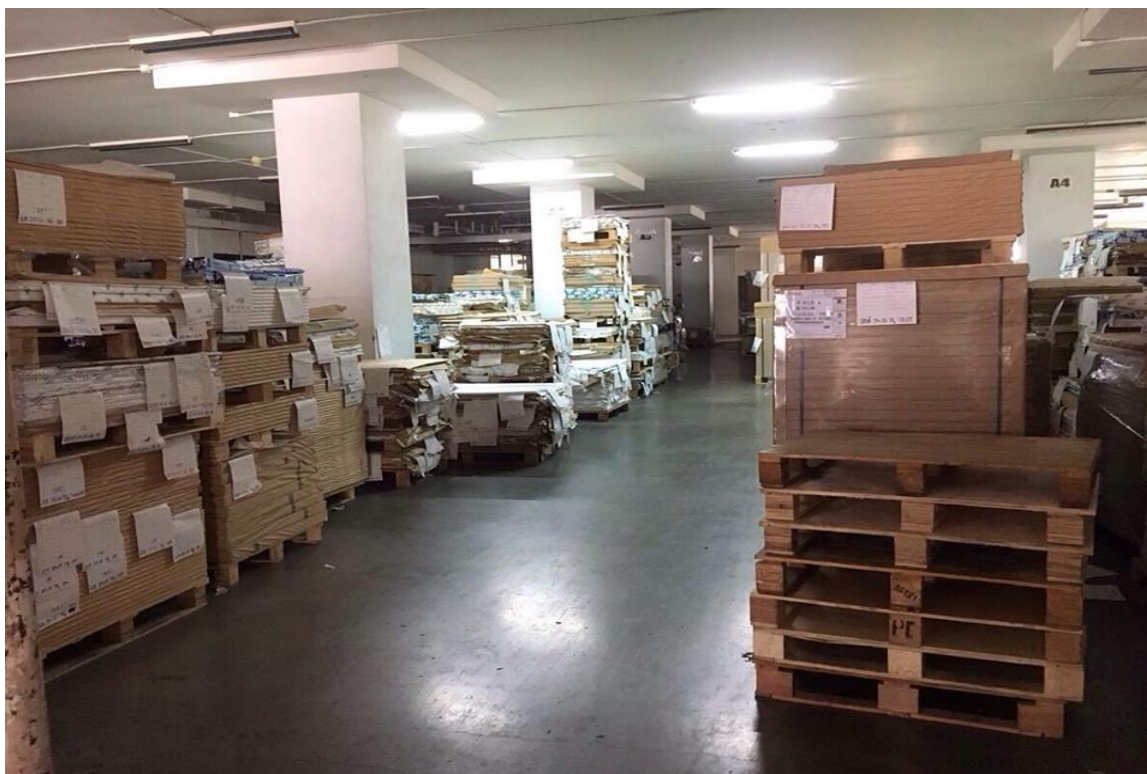
ภาพที่ ค.5 คลังเก็บวัสดุคืบกระดาษทุกชนิด