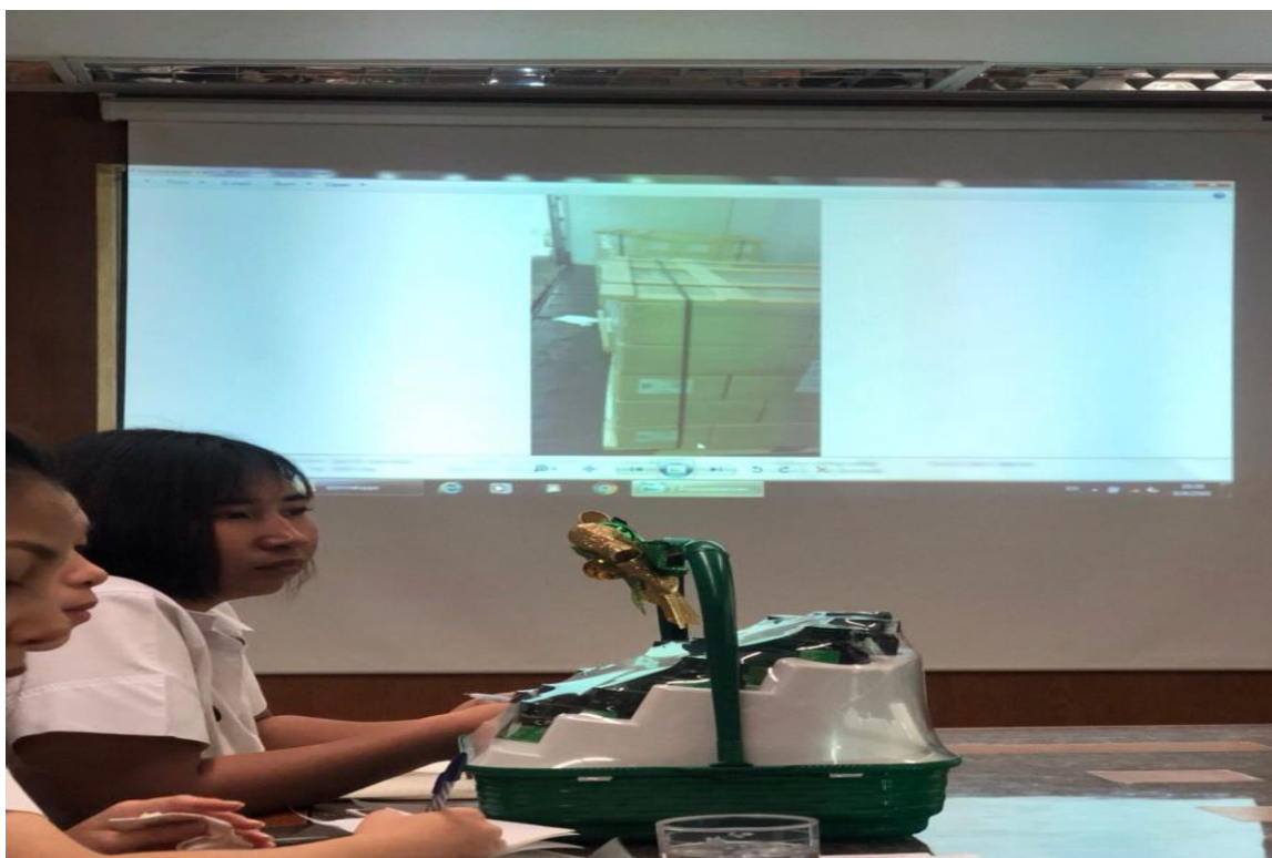
ภาพที่ ค.4 นั่งฟังวิทยากรบรรยายประวัติความเป็นมาและขั้นตอนต่างๆ