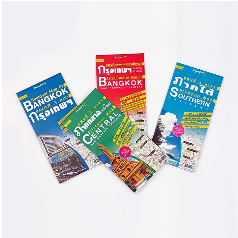
ภาพที่ 2.10 แผนที่ท่องเที่ยว