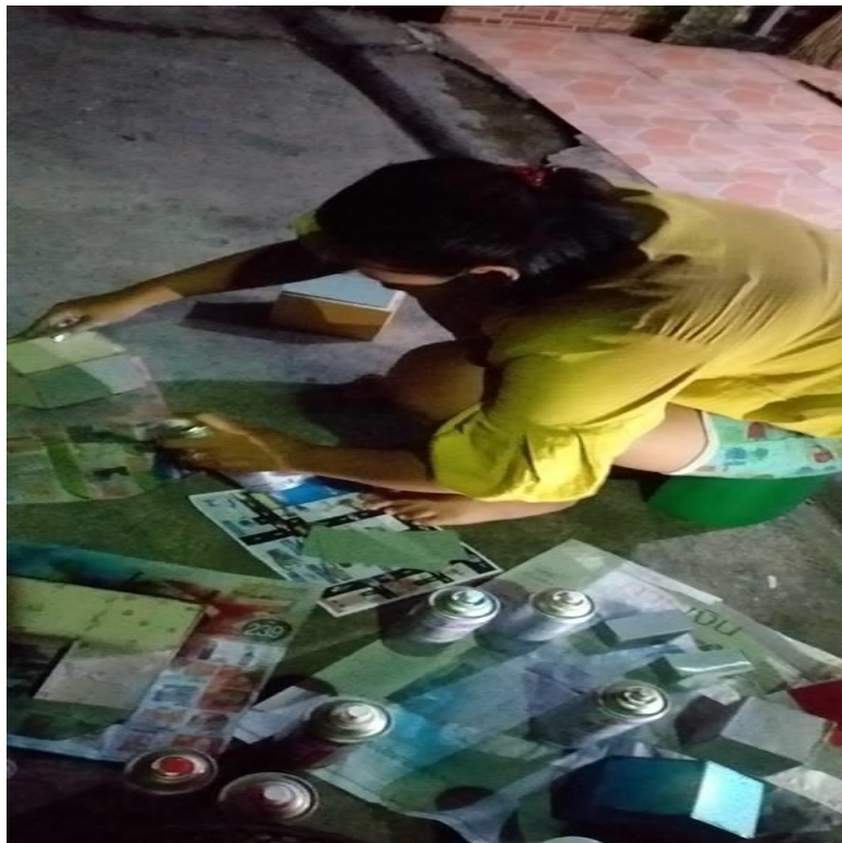
ภาพที่ ข.5 ฟันสีตัวอาคาร