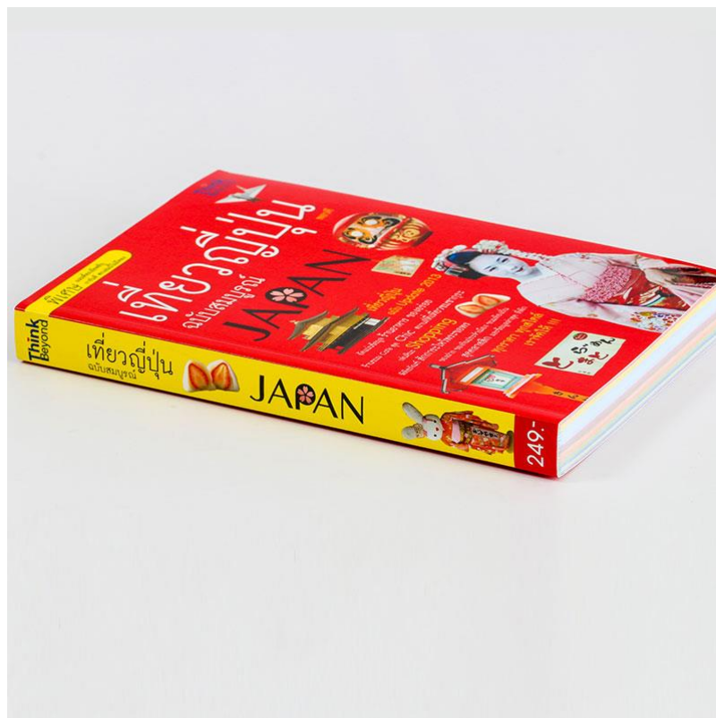
ภาพที่ 2.9 หนังสือปกอ่อน