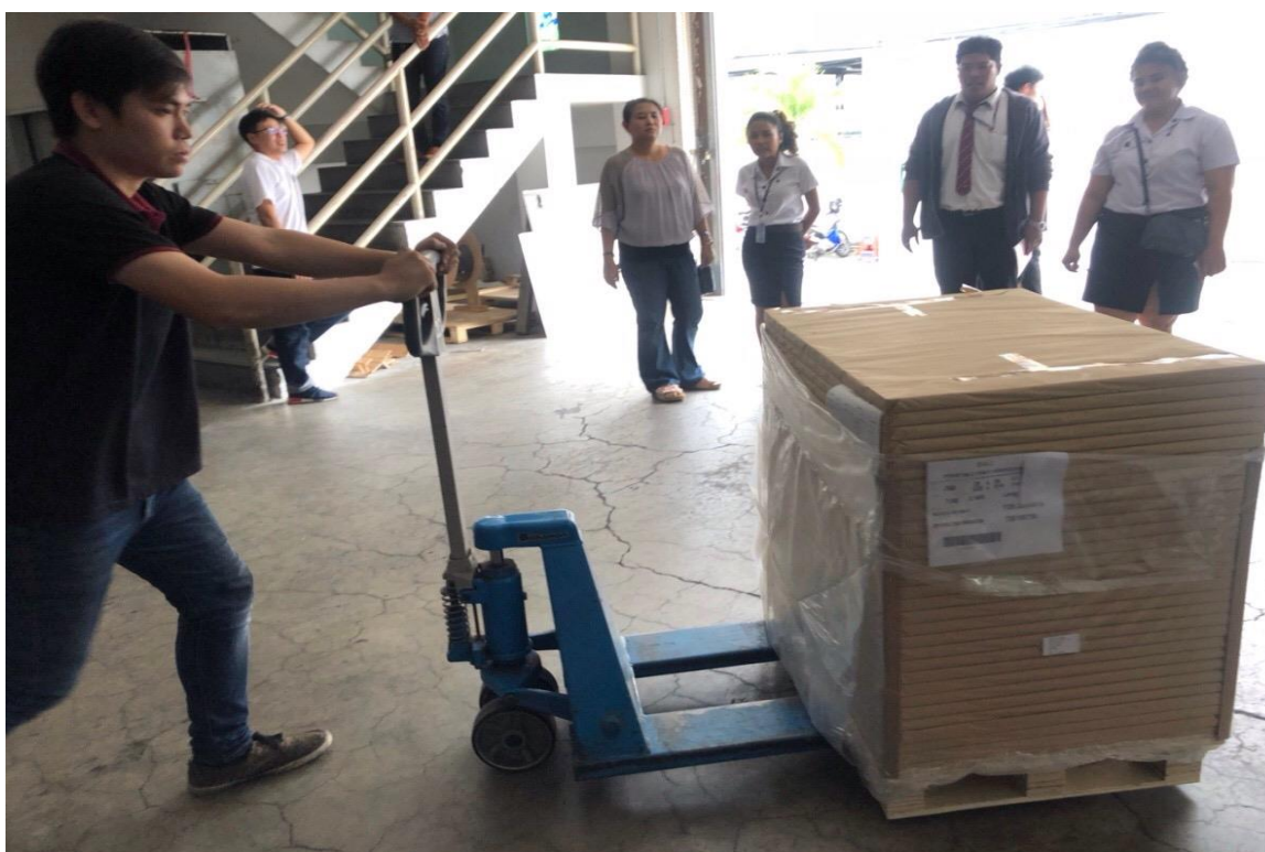
ภาพที่ ค.6 คู่มือการบรรจุผลิตภัณฑ์ในการส่งออก