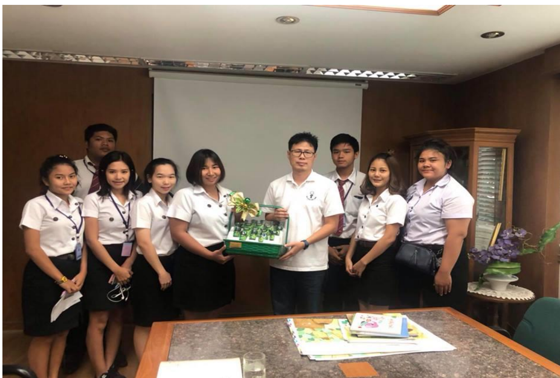
ภาพที่ ค.8 ทางคณะผู้จัดทำจึงขอมอบของเล็กน้อยในการขอบพระคุณที่ให้ความรู้ที่ดี