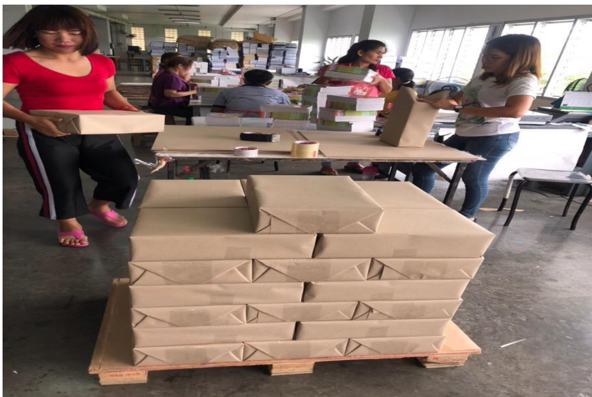
ภาพที่ ค.7 โชนของบรรจุภัณฑ์ตามเล่มของหนังสือ