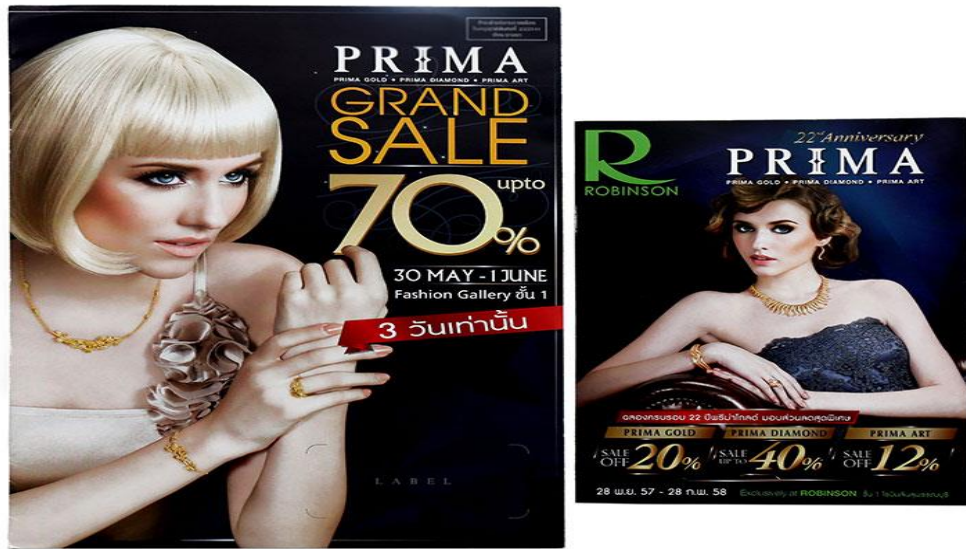
ภาพที่ 2.6 แคตตาล็อก