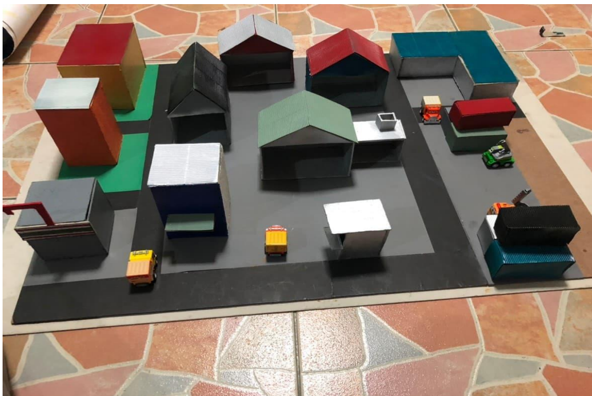
ภาพที่ ข.6 จัดวาง โครงสร้าง