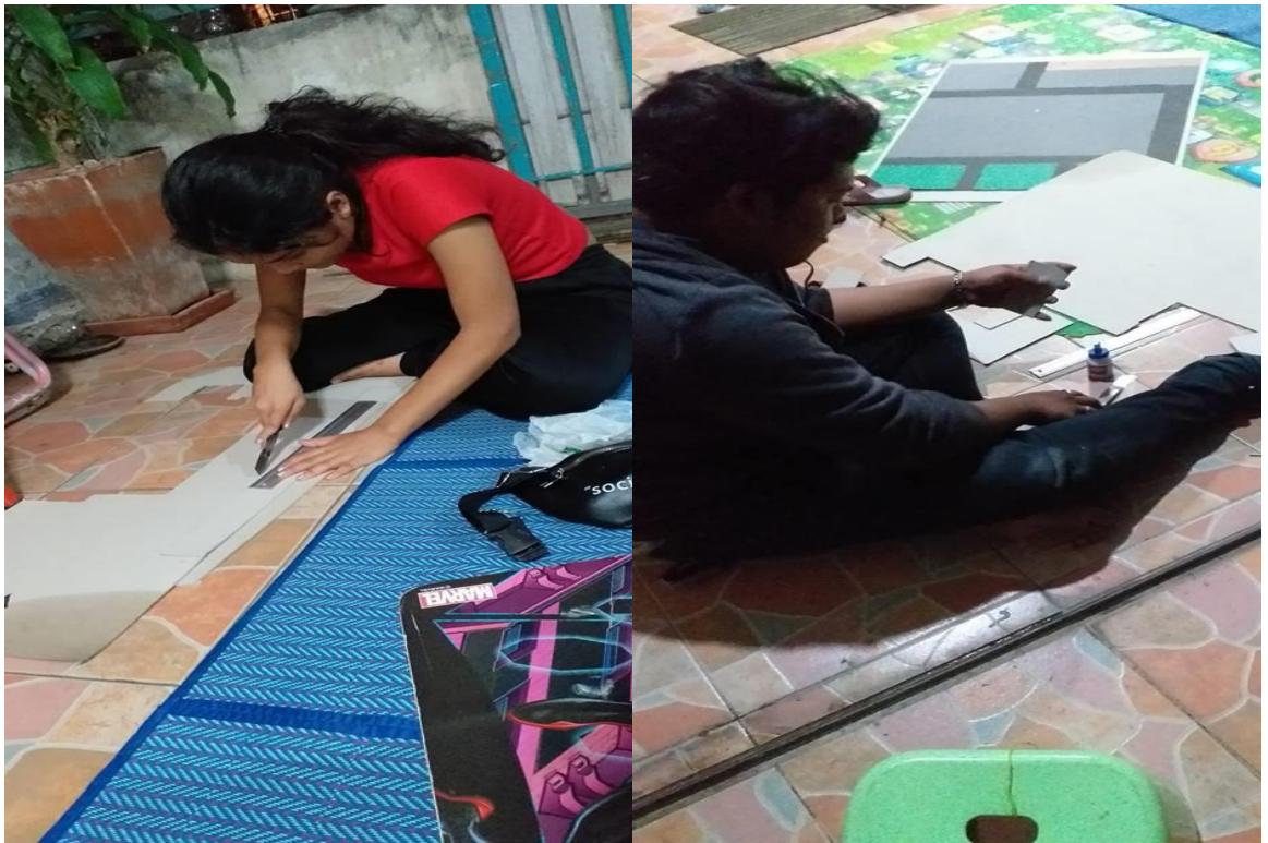
ภาพที่ ข.3 การทำโครงสร้างอาคาร2