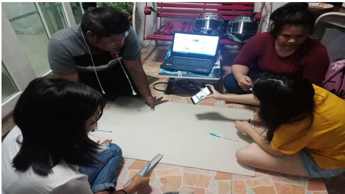
ภาพที่ ข.1 การทำฐาน โมเดล