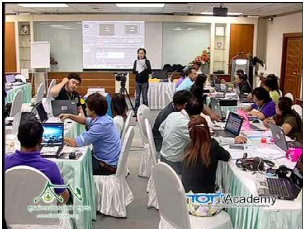
ตัวอย่างวีดิทัศน์